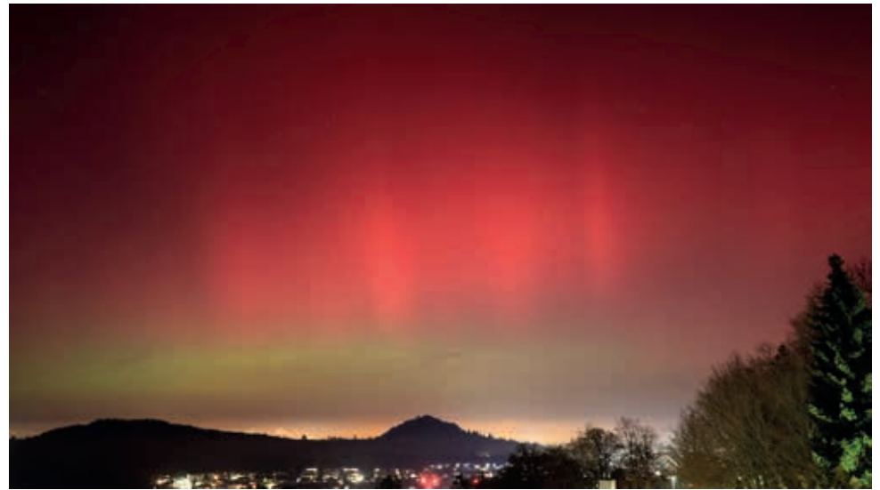
Polarlichter über der Röt und dem Georgenberg in der Nacht vom 19. Januar 2026, Foto Steffen Burgemeister.

(pr) Dank einer Einladung der evangelischen Kirchengemeinde Pfullingen beginnt der Förderverein „Sonnenstrahlen“ das Jahr 2026 mit einem besonderen musikalischen Höhepunkt: einem Benefizkonzert am Sonntag, 8. Februar, um 18.00 Uhr in der