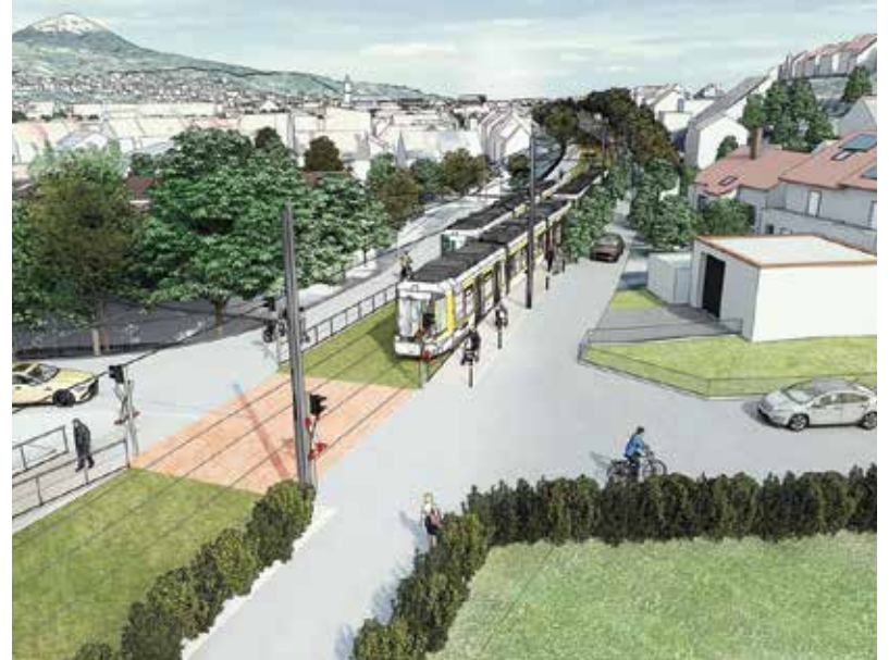
Die beiden Visualisierungen zeigen die Regionalstadtbahn auf der alten Bahntrasse. Links, vorbei am alten Bahnhof und auf dem rechten Bild in der Großen Heerstraße.

(StP) Mit einer Mehrheit von 14 Ja-Stimmen der 4 Nein-Stimmen (bei 5 Enthaltungen) gegenüber standen, votierten die Stadträtinnen und Stadträte für die alte Bahntrasse als bevorzugte Linienführung der Regional-Stadtbahn durch das Stadtgebiet. Damit gibt Pfullingen dem Zweckverband Regional-Stadtbahn Neckar-Alb als Bauherr ein klares Signal, welche Trasse aus kommunaler Sicht weiterverfolgt und vertieft geplant werden soll.