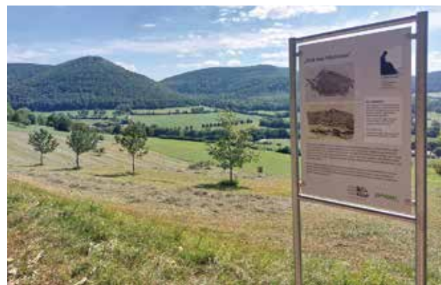
Jauch-Sichten, ist ein Projekt das von der Paul Jauch Stiftung umgesetzt wurde: Am Oberen Markweg mit Blick auf den Mädlesfels.

Der Paul-Jauch-Preis wird alle drei Jahre vergeben und ist mit 500,-Euro dotiert. Der Preisträger wird vom Stiftungsrat im Januar gewählt. Die feierliche Ehrung ist für den Bürgerempfang im März 2026 vorgesehen.