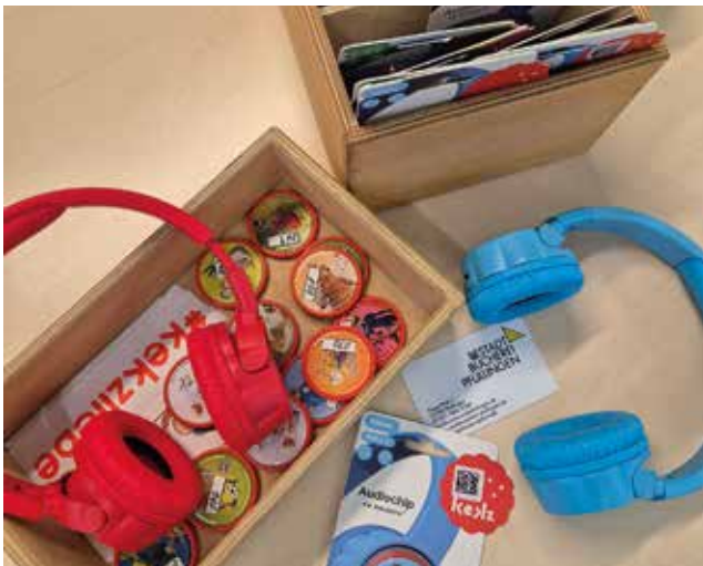
Mit den Keks-Kopfhörern können Kinder Geschichten hören und wissenswertes erlernen

Schon allein deshalb ist die Erneuerung nötig, weil man auf lange