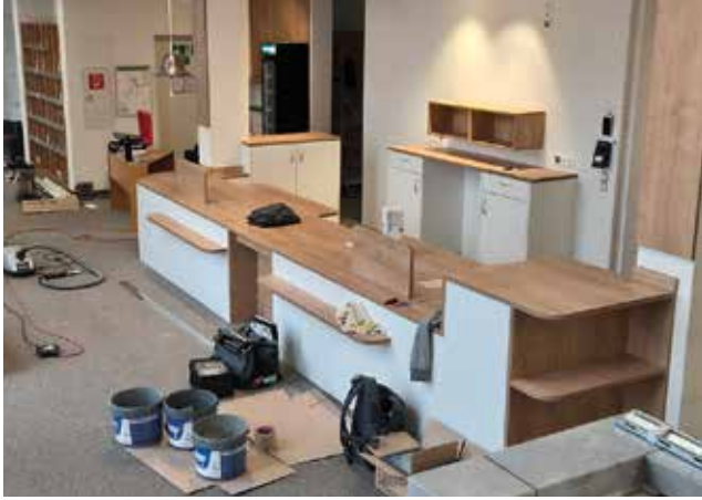
Die neue Verbuchungstheke ist beinahe fertig, voraussichtlich ab Anfang März ist die Bücherei wieder geöffnet.

(BW) Seit einigen Wochen stehen Besucher*innen vor verschlossenen Türen, wenn sie eigentlich bei der Stadtbücherei was ausleihen möchten, beim neugierigen Blick durch die Scheiben, zeigt sich aber: es tut sich was. Kabel auf dem Boden, Bohrer, Handwerksgeräte, Staubsauger. Es wird kräftig geschafft.