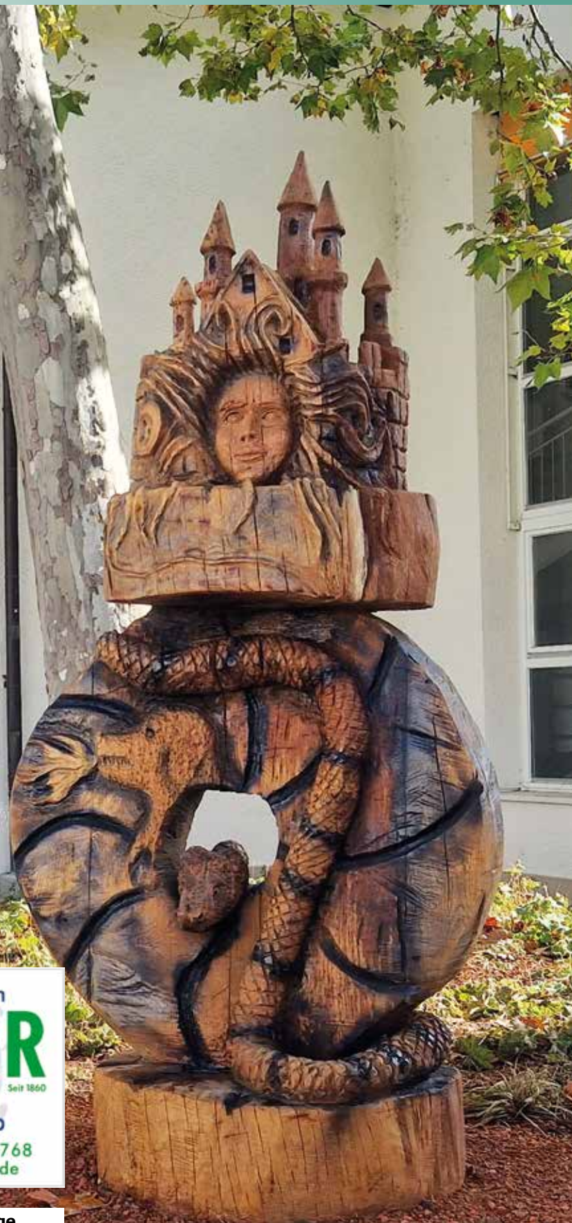
Bild: Wie die Urschel erlöst werden kann, Holzschnitzarbeit von Billy Tröge