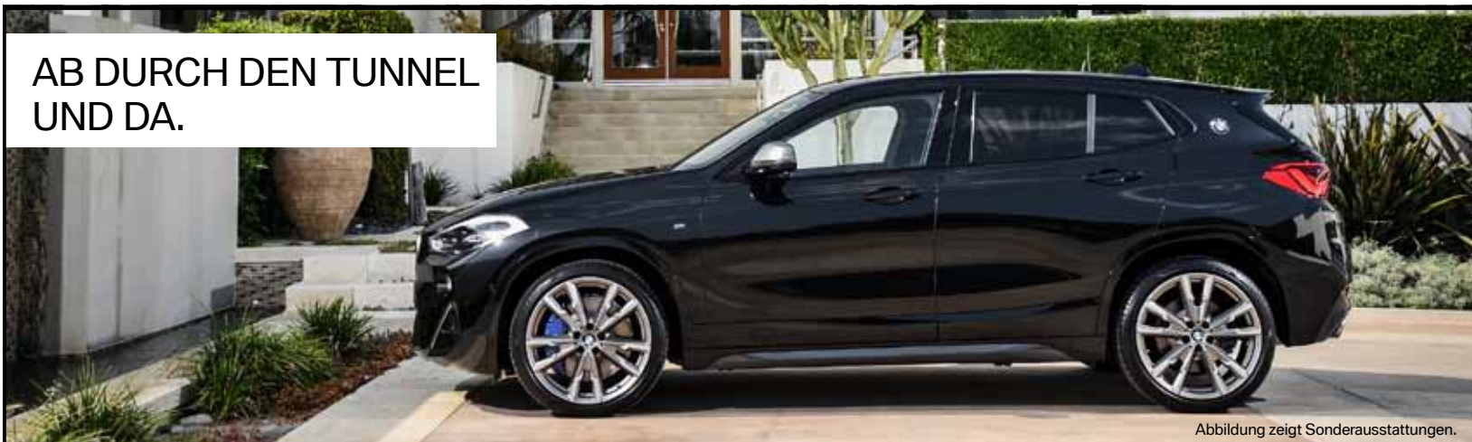
Abbildung zeigt Sonderausstattungen.