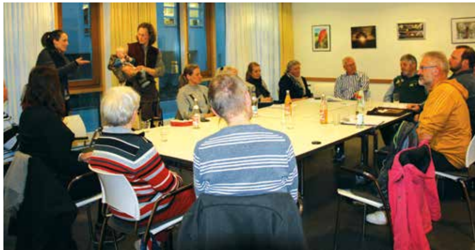
Regelmäßig trifft sich derzeit eine Gruppe von Gleichgesinnten die einen Gemeinschaftsgarten einrichten wollen. Die Suche nach einem geeignete Grundstück steht im Moment im Vordergrund.

(SH) Ein Grundstück im Grünen mit herrlichem Weitblick. Auf der einen Seite Obstbäume und Beerensträucher, auf der anderen reihen sich Gemüsebeete aneinander. Am hinteren Ende stehen Bienenkästen, deren Bewohner sich an Wildblumen erfreuen. Ganz vorne eine einladende Hütte mit schöner Grillstelle. Fehlt noch was? Ja, Strom- und Wasseranschluss und von Pfullingen aus sollte der Garten mit dem Fahrrad erreichbar sein. So oder so ähnlich soll er aussehen, der ideale Gemeinschaftsgarten.