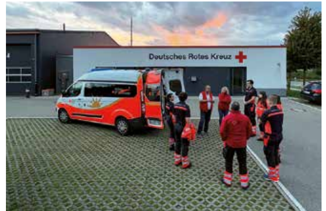
Mitarbeiter des DRK bei der Einsatzbesprechung vor ihrem neuen Fahrzeug für die Glücksmomente.