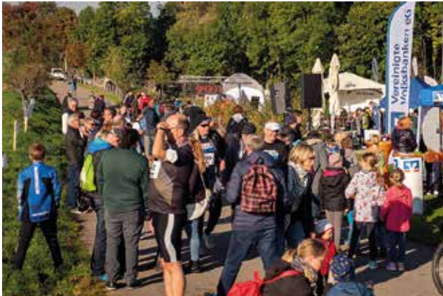
Start und Ziel der schwäbischen Meile ist das peb2.

(pr) In diesem Jahr geht der beliebte Eninger Volkslauf in seine dritte Verlängerung. Mit dem Startschuss am peb2 werden an Silvester bis zu 600 Läufer, Nordic Walker und Kinder durch das Arbachtal in Bewegung sein.