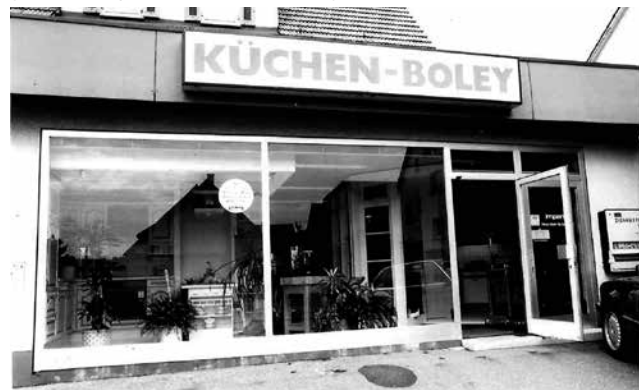
In der Kaiserstraße 80 hatte Herbert Boley das Küchenstudio 1973 eröffnet.

zum Kochen und Arbeiten da, es muss alles praktisch und funktional sein,“ sagt Sandra Herrwerth. Als Familienmensch und Mutter von drei Töchtern spricht sie aus Erfahrung, aber auch weil sie quasi im Küchenstudio groß geworden ist. Sie kennt alle Formen und Möglichkeiten der Küchengestaltung. Und waren die Küchen früher noch bunt und mit vielen Schnörkeln, sind sie heute vor allem funktional mit geraden Linien und Strukturen.