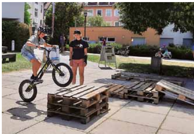
Beim Stadtfest in Münsingen konnten sich die Kinder am Trialparcour ausprobieren oder an Holz-Bewegungs-Spielen ihre Geschicklichkeit üben.

(SH) Es gibt Dinge, die ändern sich auch über Jahrzehnte nicht. So zum Beispiel in der Schule: Lieblingsfach? Sport. Warum gehst du zur Schule? Weil ich muss. Wofür brauchst du das Gelernte später einmal? Keine Ahnung. Die Antworten der heutigen Schüler unterscheiden sich nicht von denen der damaligen. Ein über viele Jahre entwickeltes Projekt von der Verkehrswacht Reutlingen-Münsingen (VKW), dem Landkreis Reutlingen und der Firma Pedalo soll diesem Zustand nun Abhilfe schaffen und Lernfreude und vor allem Bewegung an die Schulen im Landkreis Reutlingen bringen.