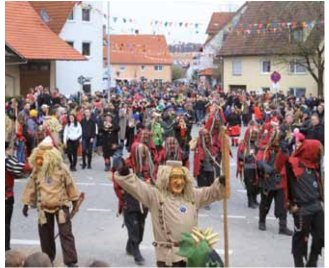
In Großengstingen findet in diesem Jahr der 33. Fasnetsumzug statt. Mit über 80 Gruppen gehört der Umzug mit zu den größten Umzügen in unserer Region.

In Engstingen wird das Rathaus zwar auch schon am Donnerstag gestürmt, die Schüler müssen sich allerdings noch bis Freitag 9.01 Uhr gedulden, bis auch sie von der Last des Schulalltags befreit werden und dann ab 13.50 Uhr zur Kinderfasnet in die TVG Halle stürmen können.