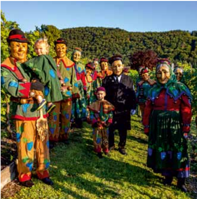
Die Eninger Häbles-Wetzer veranstalten in diesem Jahr einen Nachtumzug, bei dem rund 40 verschiedenen Narrengruppen erwartet werden, auch die Pfullinger Narren sind mit dabei.

Auch bei uns in der Region nimmt die Fasnet Fahrt auf