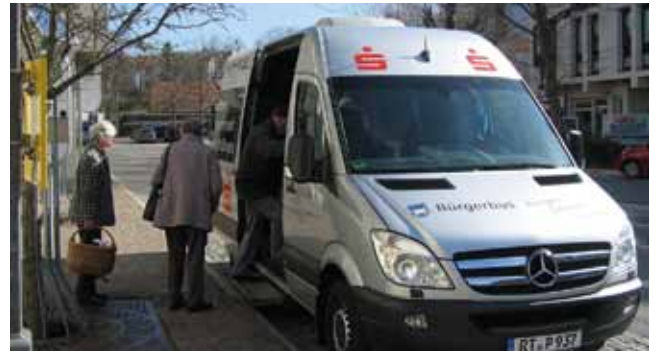
Der alte Bürgerbus hat ausgedient, sein Nachfolger wird am verkaufsoffenen Sonntag vorgestellt.

Da auch die umliegenden Gastronomen und Geschäfte an diesem Tag geöffnet haben, findet sich sicherlich für jeden Besucher ob Groß oder Klein ein abwechslungsreiches Angebot.