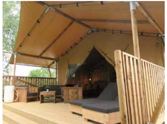
In einer echten Lodge kann man künftig komfortablen und gleichzeitig naturnahen Urlaub in Erpffingen genießen.

(BW) Nicht erst seit der Corona Pandemie und den damit verbundenen Reisebeschränkungen, bleiben die Menschen in Deutschland für ihren Urlaub lieber im eigenen Land statt großer Reisen ins Ausland. Besonders für Familien mit jüngeren Kindern wird der Urlaub in Deutschland, sei es nun am Meer, an einem See oder in den Bergen immer attraktiver. Diesem Trend trägt auch der Campingplatz in Sonnenbühl Erpffingen Rechnung. Der Betreiber die Azur Freizeit GmbH aus Stuttgart hat die erzwungene Pause durch den Lockdown genutzt und in den Campingplatz investiert. Aufgebaut haben sie sechs sogenannte Lodges. Das Prinzip stammt aus Afrika und kennt der ein oder andere vielleicht aus Filmen oder weil er selbst schon einmal eine Safari gemacht hat. Im Prinzip handelt es sich dabei um große, befestigte Zelte mit stabilen Innenwänden und schönen Holzterrassen vor dem Eingang. Darin haben bis zu sechs Personen Platz. Ein Elternschlafzimmer, ein Zimmer mit Hochbett und ein Kinderzimmer. Dazu kommt eine komplett eingerichtete Küchenzeile mit Essplatz und einem eigenen Bad und Toilette. Eine Heizung die im Sommer auch als Klimaanlage genutzt werden kann, soll außerdem noch eingebaut werden. Glamping heißt das neue Zauberwort, eine Zusammensetzung aus dem englischen Glamour (schön und schick) und Camping, das heißt sie haben alles was sonst in einer Ferienwohnung enthalten ist, wie Strom, fließend Wasser, Komfort usw. verbunden mit den Vorteilen des reinen Zeltens, nämlich die Nähe zur Natur.