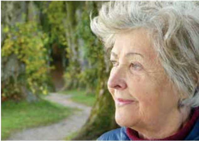
Waldbaden mit Demenz ist einer von zahlreichen neuen Kursangeboten zum Thema: „Lebenswege“

(StP) Trotz der Corona bedingten Planungsunsicherheiten wird die vhs Pfullingen auch für das kommende Frühjahr-/Sommersemester ein umfangreiches Programm anbieten.