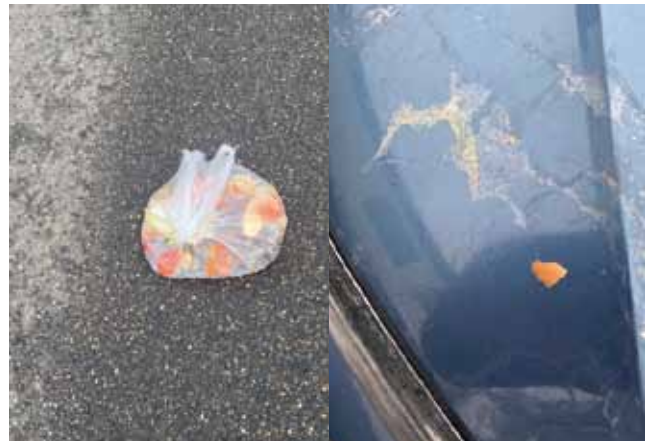
Eierschalen auf dem Auto - Müllbeutel auf der Straße, Anwohner ärgern sich über den Müllsünder.

Die Hoffnung der Anwohner ist nun groß, dass sich auf diesem Weg der Veröffentlichung möglicherweise Zeugen bei der Polizei melden, die den Täter gesehen haben oder beschreiben können.