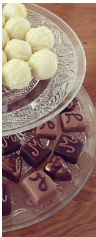
Individuell hergestellte Pralinen für eine Hochzeit, mit den Initialen des Brautpaars. (pr)