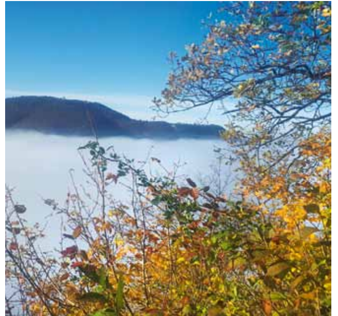
Beim Blick von der Elisenhütte ins Tal könnte man fast meinen Pfullingen sei versunken, an diesem wunderschönen Herbsttag im November, fast wie die Schlösser der Urschel.