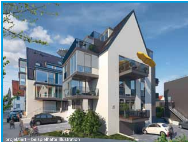
projektiert – beispielhafte Illustration