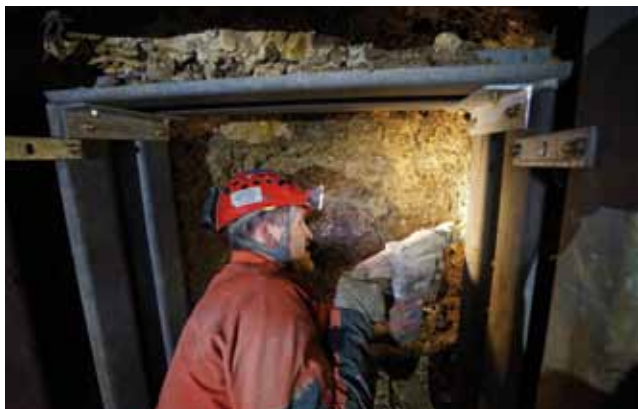
Fotos von den Grabungen.

Die „infizierten“ Höhlenforscher sind organisiert in Vereinen: die „Höhlenforschungsgruppe Pfullingen e.V.“ entstand vor 30 Jahren aus einer Interessensgemeinschaft von Lichtensteiner und Pfullinger Höhlenforschern und hat heute über 50 Mitglieder. Der Verein arbeitet eng zusammen mit der „Arbeitsgemeinschaft Höhle und Karst Grabenstetten e.V.“, die seit 1973 besteht und 170 Mitglieder zählt. Eine der Hauptaufgaben des Pfullinger Vereins ist die Dokumentation und Erforschung von über 80 Höhlen im Kreis Reutlingen. Die geologischen, hydrologischen und biologischen Beschaffenheiten einer Höhle werden untersucht, Höhlenpläne angefertigt und stetig neue unterirdische Hohlräume gesucht. Die Ergebnisse dieser Forschungen werden an Behörden und Institute weitergeleitet und teilweise in Fachzeitschriften publiziert. Im Bewusstsein darüber, dass jeder Besuch einer Höhle ein Eingriff in deren empfindliches Ökosystem ist, gehen die Vereinsmitglieder bei der Erforschung einer Höhle immer sehr vorsichtig vor.