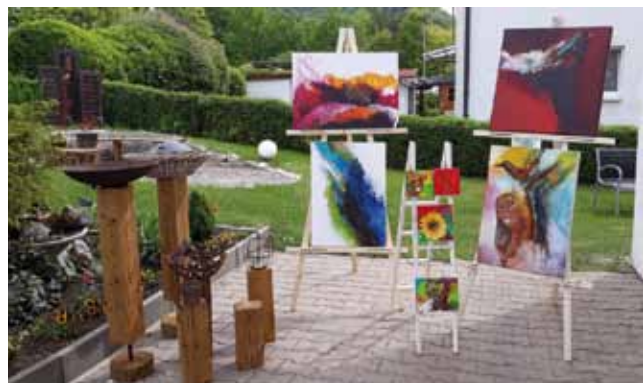
40 Künstler und Künstlerinnen stellen bei der Baumschule Rall in Eningen ihre Werke aus. Neben Malerei finden Besucher auch schöne kunsthandwerkliche Dinge.

Schauen Sie vorbei und lassen Sie sich überraschen. Die Künstler und Kunstschaffende freuen sich auf Ihren Besuch.