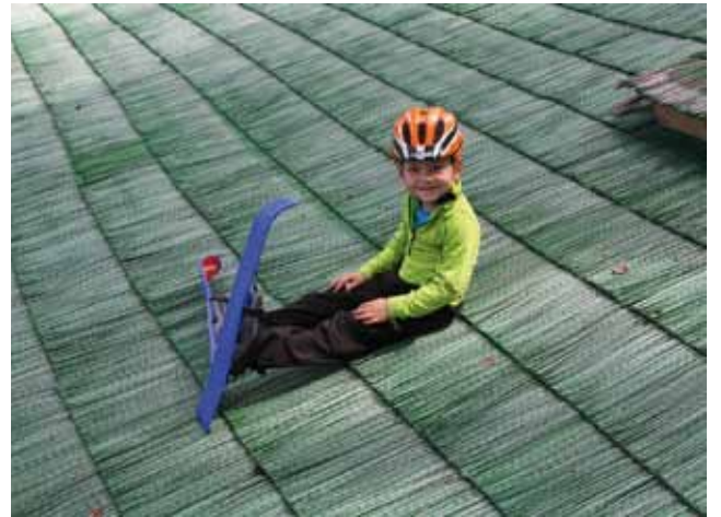
Wer hoch hinaus will, muss früh anfangen, wird sich wohl dieser junge Mann gedacht haben, als er schon mal probierhalber auf der Skisprungmatte Platz genommen hat.