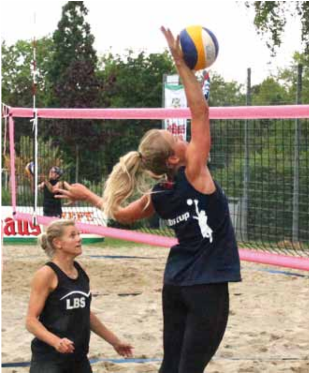
Ab 21. Juni beginnt das Beachvolleyball Turnier im Schönbergbad mit dem Schulfinale. Am 1. Juli findet mit den Damen der Baden-Württemberg Tour das Finale statt.

(rp)- Bereits zum 19. Mal richtet die Volleyballabteilung des VfL Pfullingen ihren Rothaus-Beachcup im Schönbergbad aus, umrahmt vom RP-Finale des Wettbewerbs „Jugend trainiert für Olympia“ und der Baden-Württemberg Beachtour des Landesverbands Württemberg. 10 Tage lang wird also wieder gepritscht, gebaggert und geschlagen, was das Zeug hält und alle Teams, egal ob Freizeitvolleyballer oder Leistungsvolleyballer schätzen die familiäre Atmosphäre der Turniere und das herrliche Ambiente, das vielleicht höchstens noch von Beachvolleyballanlagen an einem See übertroffen wird.