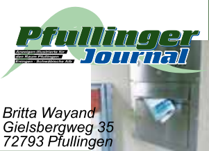
Britta Wayand Gielsbergweg 35 72793 Pfullingen

Wir suchen eine(-n) zuverlässige(-n) AusträgerIn für ein Teilgebiet in Udingen Für Schüler, Rentner oder Hausfrauen bestens geeignet. Einmal im Monat für 4 Stunden. Wir freuen uns auf Ihren Anruf unter: 07121- 70 65 68, oder e-Mail an: info@pfullinger-journal.de