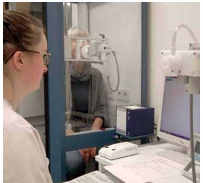
Mit einem solchen Lungenfunktionsgerät kann festgestellt werden, wie gut ihre Atmung funktioniert und ob sie möglicherweise an Asthma leiden.