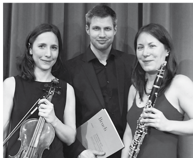
Das Wupper Trio, mit Violine, Klavier und Klarinette. Sie haben ein großes Repertoire an klassischen und jazzigen Stücken, das sie am 28. Januar dem Eninger Publikum vorspielen werden.