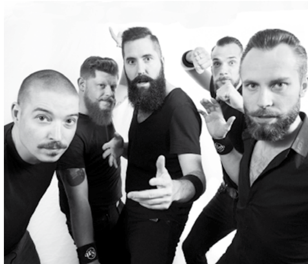
Die Reutlinger Rockband Walter Subject treten im Kult 19 in Eningen mit ihrer neuen CD "Just dance..." auf.

Walter Subject gibt es seit 2008. Sie erfinden den Rock'n'Roll nicht neu, aber sie verleihen ihm ein neues Gesicht - sind kompromisslos, rotzig, laut, tanzbar ... Bei unzähligen Auftritten - in