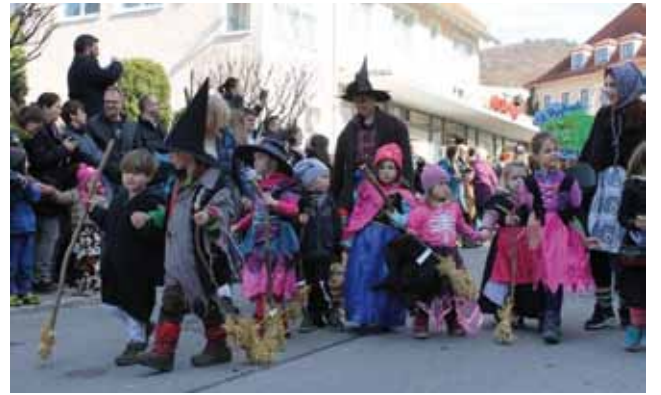
Der Kinderumzug in Eningen ist für die Kindergartenkinder dort immer ein besonderes Ereignis.

rauf, denn dann werden sie ab 9.00 Uhr von der Schule befreit. Am Sonntag den 11. Februar organisiert die Lichtensteiner Blasmusik die Kinderfasnet in der Lichtensteinhalle ab 13.00 Uhr. Dort wird dann auch die Fasnet am Dienstag, den 13. Februar um 19.00 Uhr feierlich verbrannt.