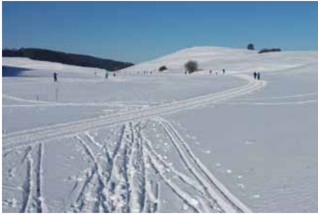
Da muss man in der Schweiz und in Österreich schon lange suchen, bis man solche Pistenparadiese findet und wenn, dann sind sie überfüllert.