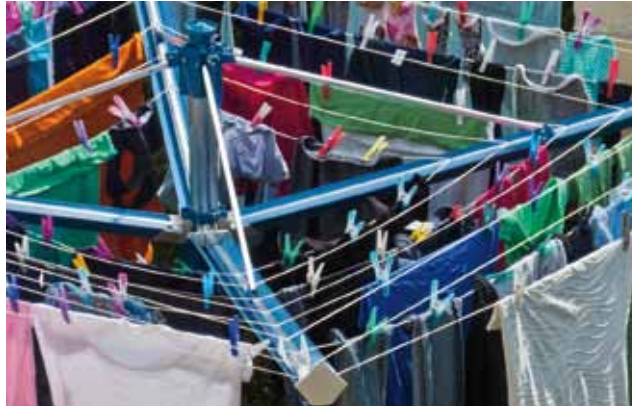
Haben Sie sich schon einmal fürs Wäscheaufhängen bedankt?

Auch das Putzen hat sich total verändert. Niemand mehr schrubbt mit Scheuersand und Schmierseife Dielenböden. Für jeden Dreck gibt es einen Spezialreiniger und manchmal wirken die sogar. Die Anforderungen an Sauberkeit und Hygiene laufen auseinander. Da gibt es die einen, welche sich vor Bakterien oder Bazillen grausen, die solange Toilette, Bad und Küche desinfizieren, bis diese Winzlinge gegen alles resistent geworden sind und sie selbst unter