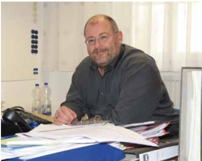
Nach knapp 18 Jahren als Stadtpfleger in Pfullingen übernimmt er jetzt das Amt des Bürgermeisters in Grabenstetten.