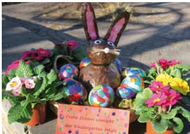
Solche niedliche Osternester haben die Kinder des Hägle-Kindergartens mit ihren Erzieherinnen gebastelt. In sechs Geschäften der Innenstadt sind sie zu finden.

Erfahren Sie, welche Bewegungen Ihren Körper trainieren und probieren Sie unter Anleitung aus, was Ihnen gut tut. Die Einführung beginnt am Sonntag, den 19. März um 15.30 und um 16.30 Uhr im Park der Villa Laiblin.