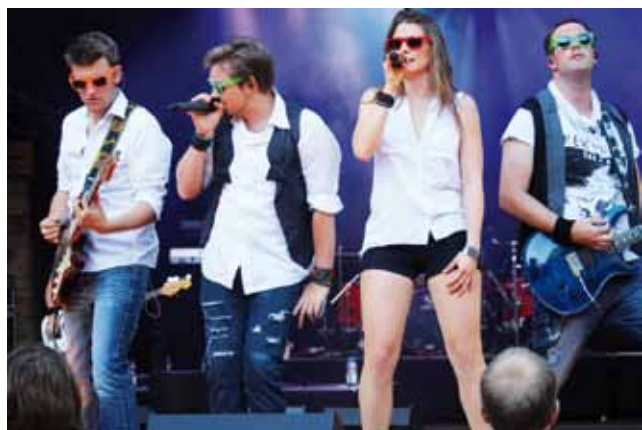
Die Band "feel" wird am Samstagabend den Besuchern mit Rock und Pop aus den 80ern kräftig einheizen.